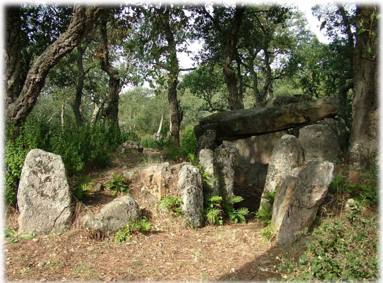
El paisatge ens parla: del Neolític al segle X. Agrupació Astronòmica de Girona