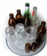
POTS (de vidre i sense tapa)