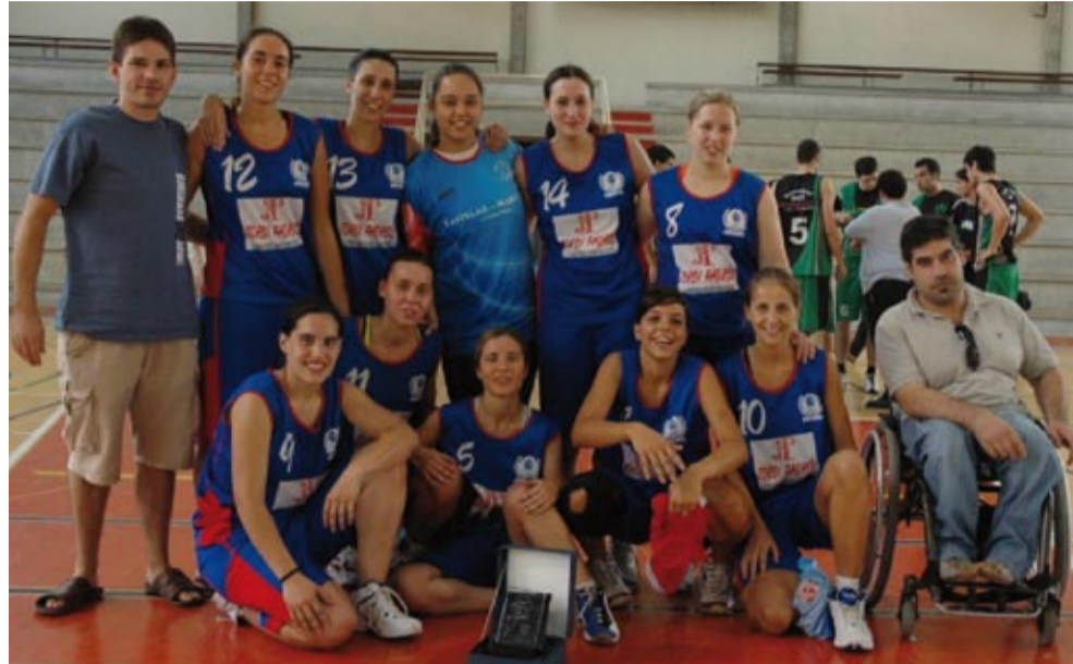
Equip sènior femení "A" del CBLL temporada 2008/09

L' equip Sènior Femení del CB Llagostera s'ha proclamat subcampió de la trentena edició del Trofeu Memorial Mateo Pell, que cada any enfronta els millors equips gironins de les diverses categories. Després d'eliminar en semifinals l'Uni Girona per un ajustat 51 a 50, varen caure en la final davant del GEIEG, que tot i ser un equip d'una categoria superior a la del CBLL, va haver de