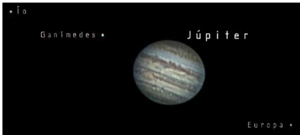
Júpiter i 3 dels seus satèl·lits.

Bon estiu i bones i merescudes vacances, que a aquest tema sí que li escau la dita "al César el que és del César"!