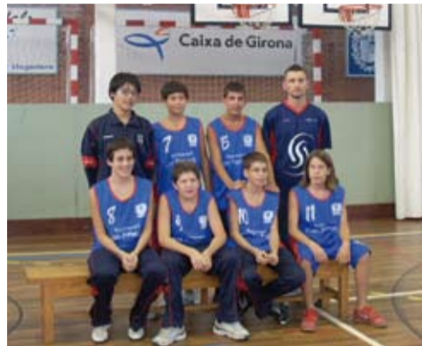
Equip infantil masculí del Club Bàsquet Llagostera

Finalment, però, i després d'una agònica pròrroga de tres minuts, el resultat es va decantar a favor del C. E. Caldes per 62-64. Enhorabona a tota la plantilla i a l'entrenador pel sots campionat i per la gran temporada portada a terme. Recordem que la temporada anterior, 2006/07, també van assolir el sots campionat.