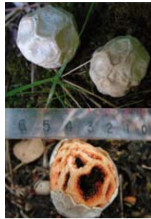
Gita de bruixa

I aquest juny atípic ens ha portat una nova sorpresa: les pluges abundants d'aquesta entrada d'estiu, la forta calor enregistrada a Llagostera (fins a 33°C a l'hora d'acabar aquestes línies), la marcada amplitud tèrmica (diferències entre la màxima i la mínima de més de 20°C) i les fortes humitats (més del 70% de mitjana), han afavorit que els nostres boscos es poblessin de manera sobtada amb bolets, amb varietats típiques de la tardor. En efecte, les pluges del maig i juny i les temperatures suaus a les nits i altes