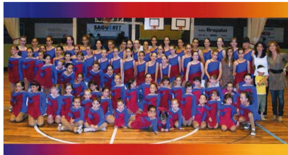
Club Patinatge Llagostera. Foto de club 2008

Pel que fa al mes de juny, el Club Patinatge Llagostera a participat a les proves de