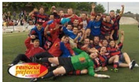
U.E. Llagostera, el primer equip ascendeix a Primera Catalana

Per acabar, volem felicitar la Junta Directiva de la Unió, cos tècnic i col·laboradors, per l'excel·lent treball portat a terme, cadascú en la seva vessant, així com agrair als seguidors que han fet costat a l'equip i d'una manera molt especial, al centenar de llagosterencs que es van desplaçar fins a Martorell per acompanyar a l'equip en aquest dia històric de l'ascens a Primera Catalana.