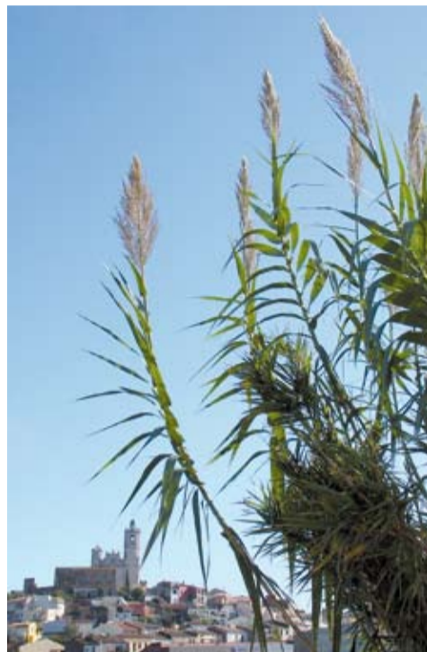
Plomalls als marges de la riera Gotarra

Per si de cas, i perquè en quedi constància, us acompanyo el text amb una fotografia