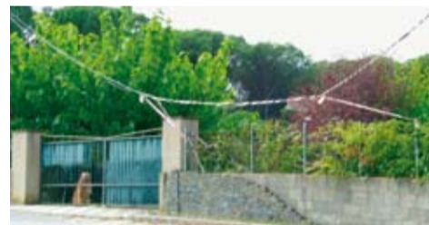
Residencial Llagostera.

Des del mes d'agost que es va despenjar aquest cable de telèfon, podem veure aquesta imatge només entrar a la Urbanització la Canyera, després de passar la riera. Arran de les últimes pluges, el cable ha anat cedint i ja toca gairebé a terra, de manera que els cotxes, quan fan el revolt, tenen perill d'endur-se'l per endavant. Els veïns ja ho hem comunicat a l'Ajuntament i Telefònica no deu tenir prou recursos per enviar algun operari a reparar-lo.