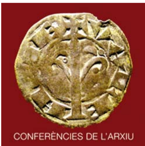
CONFERÈNCIES DE L'ARXIU

Ha fet exposicions individuals i col·lectives a Barcelona, Mollet i Tenerife. L'exposició tindrà es farà al Casino, de l'1 de desembre de 2009 al 10 de gener de 2010.