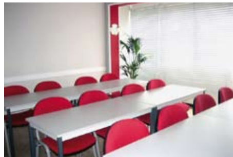
Escola Nàutica Palamós

I els preus? Molt ajustats, si considerem les hores que hi invertim. La despesa de la part teòrica es pot fer efectiva en dos o tres pagaments i les pràctiques de ràdio i navegació en el moment en què l'alumne les contracti, segons la seva disponibilitat.