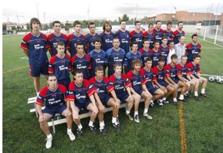
U.E. Llagostera 2009/10.

La U.E. Llagostera ha organitzat enguany el I Torneig d'estiu de Futbol-7 i ha comptat la participació d'uns 130 jugadors repartits entre els 11 equips participants. Ha estat un èxit de participació i de públic que ha gaudit d'aquest torneig futbolístic, tot parant la fresca, en les caloroses nits del mes de juliol. El guanyador ha estat l'equip "Tèxtil Tarragó Team", que es va imposar a la final a l'equip del "Clàssic Cafè" (5-3). El tercer lloc va ser per l'equip "Extintors Girofoc". Per al proper 21 d'agost s'està preparant un torneig de 24 de Futbol-7 que començarien el divendres 21 d'agost a les 9 del vespre i acabarien l'endemà dissabte, 22 d'agost, també a les 9 del vespre. Per a més informació, adreceu-vos al bar del camp de futbol o a les oficines del Patronat Municipal d'Esports. Tel. 972805384.