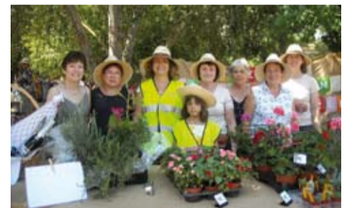
Comissió de flors del Casino