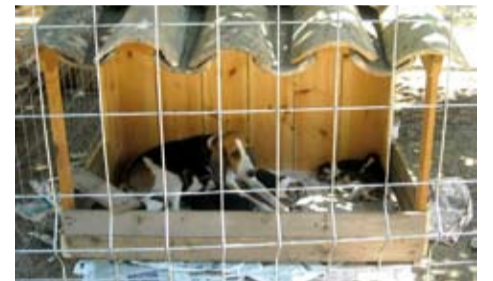
Mostra de gossos de caça

El 26 de juliol es va celebrar la segona edició de la Fira del Batre, una fira basada en el món local i rural organitzada per l'Àrea de Cultura i de Promoció Local de l'Ajuntament, conjuntament amb el col·lectiu de pagesos, l'Associació de Caçadors i la Unió de Botiguers. La fira va tenir lloc al parc de l'Estació amb una programació plena d'activitats per a tots els públics que es va allargar durant tot el dia. Entre les activitats programades, cal destacar la demostració de batre, la concentració de cotxes i motos d'època, la música tradicional amb Gralla de Boix, la mostra de gossos de caça, les passejades amb guarans catalans, el concurs de tallada de troncs, la tractorada i el ball de bastons, entre d'altres. La jornada va finalitzar amb un sopar i una cantada d'havaneres.