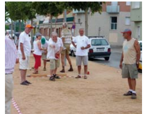
Imatges del refrigeri