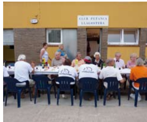
Imatges del campionat