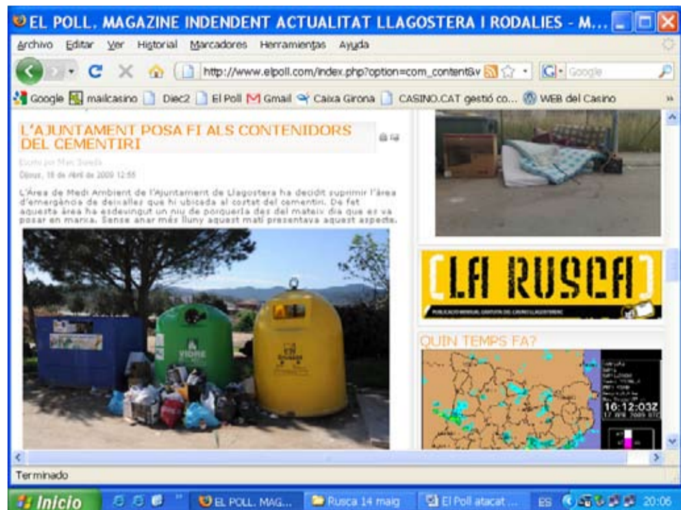
Nova imatge de "El Poll"

d'imatge, però encara continua treballant per recuperar més de 3.000 notícies i més de 6.000 missatges publicats en el fòrum durant els darrers 4 anys. El Poll agraeix a tots els col·laboradors, amics i anunciants els missatges de suport rebuts.