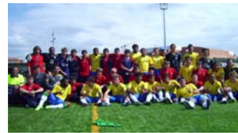
U.E. Llagostera - Selecció Cadet Brasil ( MIC )