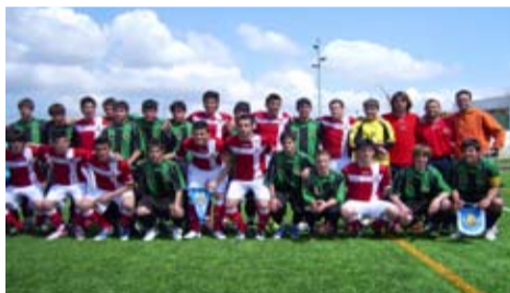
U.E. Llagostera - R.C.D. Espanyol ( Cadet - MIC )

Cal remarcar, també, a part del bon nivell futbolístic que es va poder veure al camp, la magnífica col·laboració de l'Ajuntament de Llagostera i el bon treball del club amfitrió, la U.E. Llagostera, que va atendre de la millor manera possible a tothom que ens va visitar durant aquests quatre dies de Setmana Santa i tant jugadors, com tècnics, com aficionats es van sentir com a casa seva. Per tots aquests motius podem dir que ha estat un gran èxit per Llagostera poder ser una de les seus del MIC i tothom n'ha quedat molt satisfet.