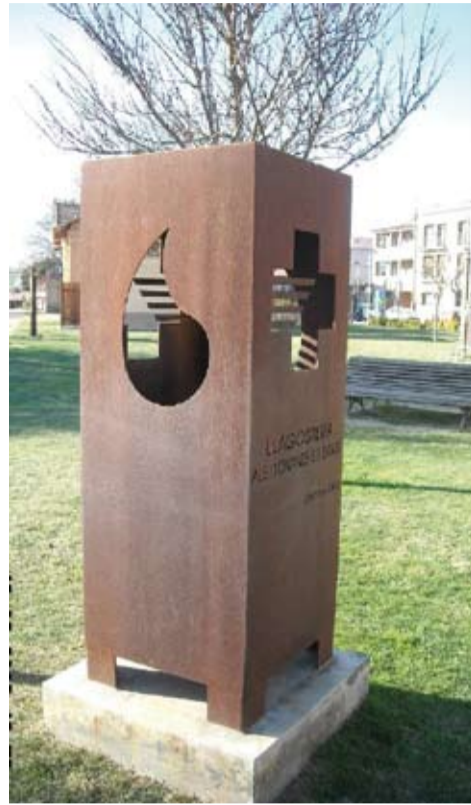
Autor escultura: J. Antonio Hierro Gutiérrez, situada al Parc de l'Estació. Es va inaugurar el 29 de juny de 2002

Animem a tots els llagosterencs que vinguin al Casino Llagosterenc, el dia 25 d'abril, de les 10 a les 14, a donar-ne, perquè vindrà la unitat mòbil a fer-ne les extraccions.