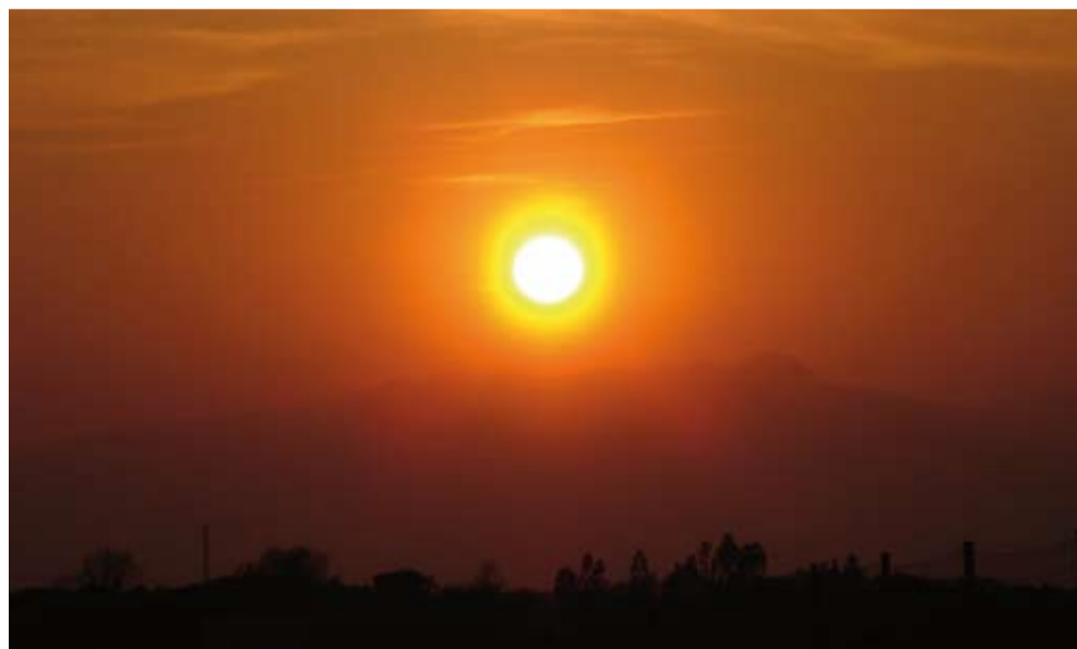
Posta de Sol sobre el Montseny, fotografiada des de Llagostera el 15/03/09 a les 18:25.

Als més nostàlgics, el títol d'aquestes ratlles els haurà transportat directament als més gloriosos dies del cinema en Technicolor, dies en què passar del blanc i negre al color esdevenia potser una fina metàfora de les noves esperances que tota societat albira per definició. En el nostre cas (i fugint de les incerteses d'un temps convuls), les esperances renovades ens les aporta generosament (a manca d'altres actors), la primavera. La nova estació ens va sorprendre el dia 20 de març al migdia, quan el Sol, empès pels engranatges celestes, va gosar superar l'equador i alçar-se sobre l'horitzó de l'hemisferi nord amb una ferma promesa estival. Era l'equinocci de primavera i el dia i la nit sobre Llagostera van tenir exactament la mateixa durada, moment màgic sens dubte!