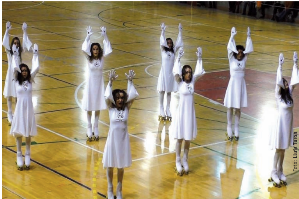
C.P. LLAGOSTERA, Grup Xou Petit "Cor"

El passat 7 de febrer va tenir lloc al Pavelló de Fontajau de Girona el Campionat de Catalunya de Grups Xou pel que fa a la categoria de Xou Petits.